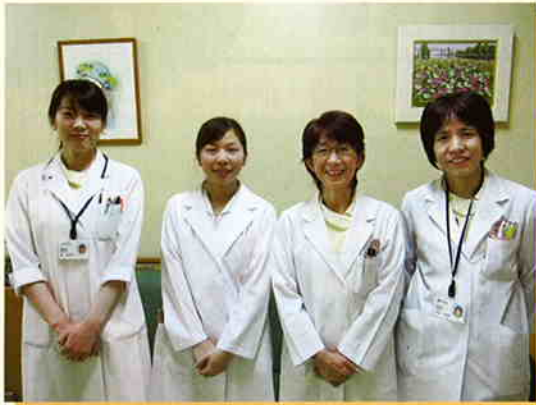
▲乳がん検診：女性スタッフ

現在女性がかかるがんの中で最も多いのが乳がんです。16人のうち1人(H22年度時点)は乳がんにかかると言われております。