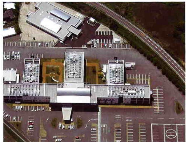
▲西田病院上空より